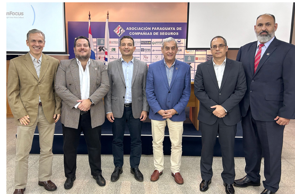
Miembros de la Comisión Directiva de la APCS.

“Como Asociación, uno de los grandes desafíos y preocupaciones que tenemos es el porcentaje de la población que adquiere seguros. La participación del mercado asegurador en el Producto Interno Bruto (PIB), que es 1.08% de participación, una cifra baja. En cualquier país del mundo, esa participación se consideraría muy baja y nosotros tenemos que conseguir aumentar esos números.”